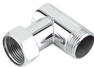
Уголок переходной G 3/4" НР x 3/4" НГ арт. 02002-3434