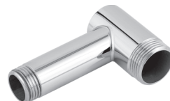
Уголок переходной G 3/4" НР x 1/2" НР арт. 02003-3412