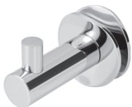
Вешалка-крючок для моделей «Версия-Б1; Н1» арт. 00100-0050